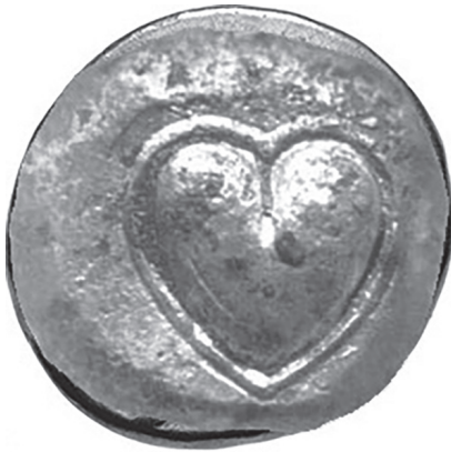
ABBILDUNG 3: Unbekannter Künstler, Drachme mit Samenschale der Silphiumpflanze, um 510–490 v. Chr. Heiligtum von Deme- ter und Persephone, Kyrene, Katalog- nummer 14.

(65–8 v. Chr.), Properz (ca. 50–15 v. Chr.) und Ovid (47–17 v. Chr.) thematisierten gerne die Herzen, die von Venus erregt oder von Amors Pfeilen durchbohrt waren.