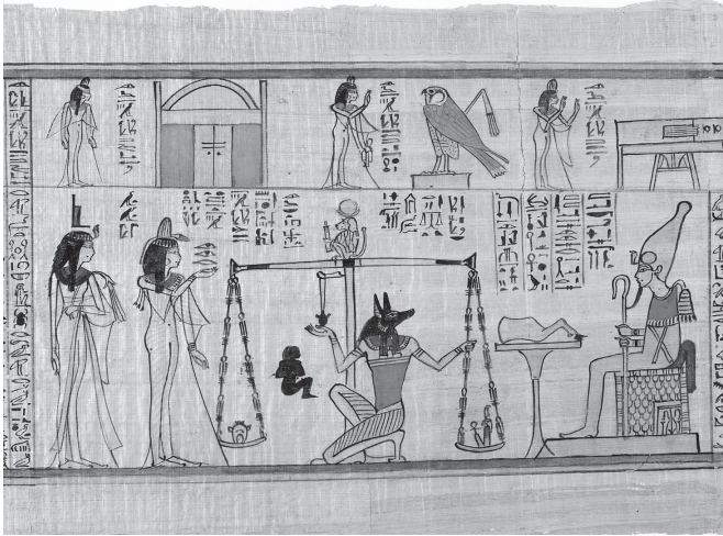
ABBILDUNG 2: Der Sänger von Amun Nany, Bestattungspapyrus (Detail), 1050 v. Chr. Papyrus, Farbe. Metropolitan Museum of Art, New York, Rogers Fund, 1930.

die diversen Religionen mit dem Liebesherr umgegangen? Um diese und ähnliche Fragen wird es in diesem Buch gehen.