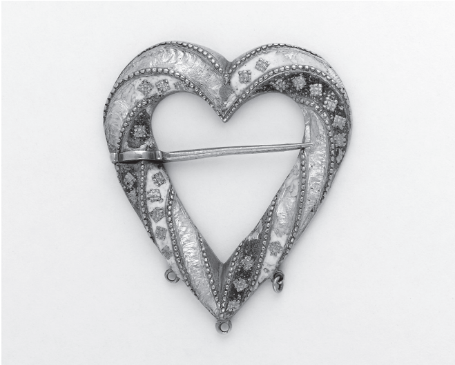
ABBILDUNG 1: Unbekannter Künstler, Brosche aus dem Fishpool-Schatz, 1400–1464. Britisches Museum, London, England.

Die Anregung für dieses Buch war ein Geistesblitz im Britischen Museum, wo ich 2011 eine Ausstellung über mittelalterliche Kunst besuchte und fasziniert war von den Goldmünzen und dem Schmuck aus dem 1966 in Nottinghamshire entdeckten Fishpool-Schatz. Viele der Exponate waren in Frankreich entstanden und hatten französische