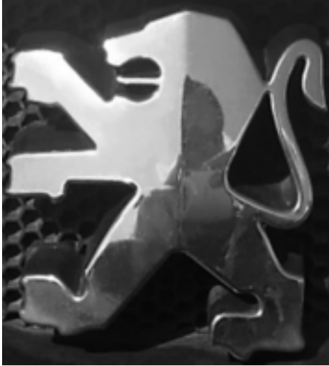
5. Der Peugeot-Löwe

Man könnte fast den Eindruck bekommen, als wäre Peugeot gar nicht Teil unserer physischen Realität. Existiert es denn überhaupt?