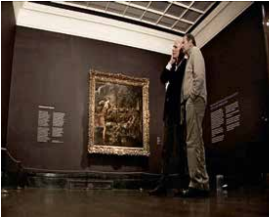
Abb. 5: Lucian Freud in der National Gallery, London, mit Tizians Tod des Aktaion (um 1559 – 1575); er betrachtet das Gemälde Diana und Aktaion (um 1556/59). 28. Oktober 2008. Standbild aus dem Video Lucian Freud Exhibition . (©: ITN Source.)

Ill. 5: Lucian Freud at the National Gallery, London, with Titian's The Death of Actaeon (1559–75) and looking at Diana and Actaeon (1556–59). 28 October, 2008. Still from the video Lucian Freud Exhibition . (©: ITN Source.)