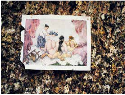
Abb. 2: Cézanne. 2000. Photo von David Dawson. Privatsammlung. (©: Dawson, David, b. 1960/The Bridgeman Art Library.) Ill. 2: Cézanne. 2000. Photograph by David Dawson. Private Collection. (©: Dawson, David, b. 1960/The Bridgeman Art Library.)